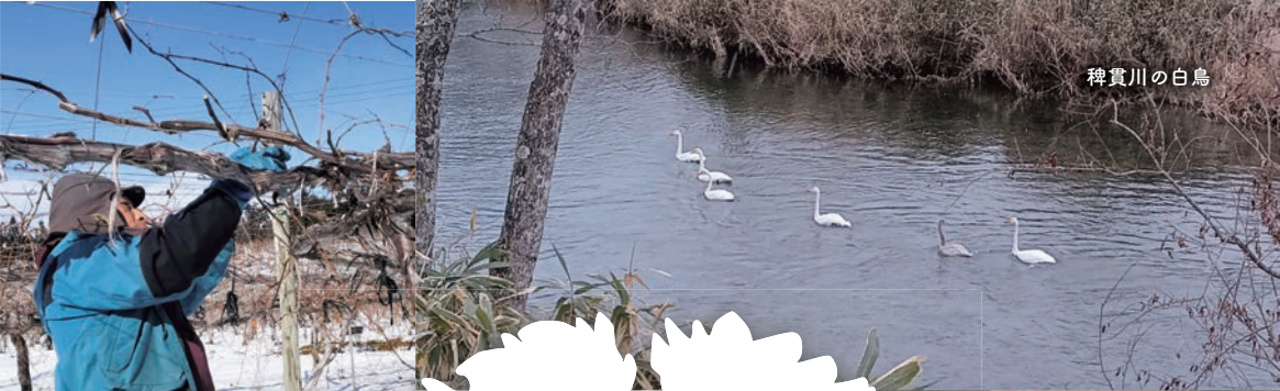
せん ブドウの剪定