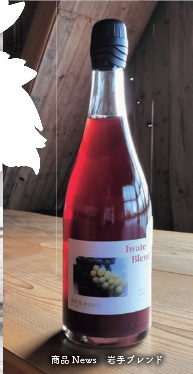
商品 News 岩手ブレンド